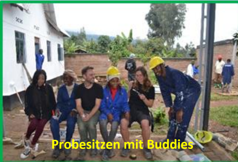
Probessitzen mit Buddies